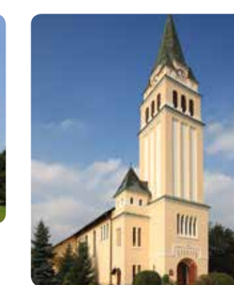
Evangeličanska cerkev Dobrega pastirja Jezusa, Moravske Toplice

Im Laufe der Jahrhunderte ... entstanden hier zahlreiche Sakral- und Kulturdenkmäler und historische Monumente. Besuchen Sie diese Orte auf Ihren Ausflügen und entdecken Sie das spezifische Architektur- und Kunsterbe von Moravske Toplice. ... entstanden hier zahlreiche Sakral- und Kulturdenkmäler und historische Monumente. Besuchen Sie diese Orte auf Ihren Ausflügen und entdecken Sie das spezifische Architektur- und Kunsterbe von Moravske Toplice.