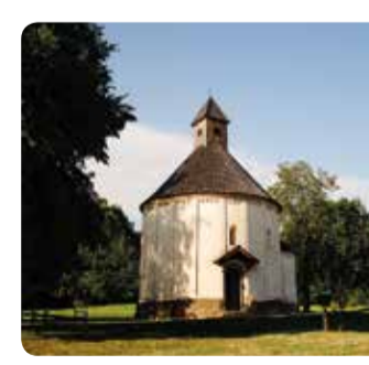
Cerkev sv. Nikolaja in Device Marije, Selo ROMANSKA ROTUNDA

Čas merjen v stoletjih ... je izobiljal številne sakralne, muzejske in kulturne objekte. Obiščite jih na vašem potepu in odkrivajte arhitekturne in umetnostne presežke dediščine Moravskih Toplic. Time measured in centuries... has given many sacred and cultural buildings and relics displayed in museum facilities. You can visit these establishments while exploring the area and its architectural and artistic artefacts which are part of the local heritage.