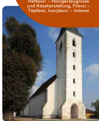
Cerkev sv. Martina, Martjanci