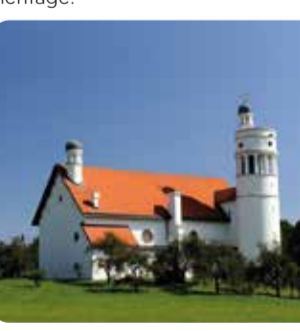
Cerkev Gospodovega vnebohoda, Bogojna PLEČNIKOVA CERKEV