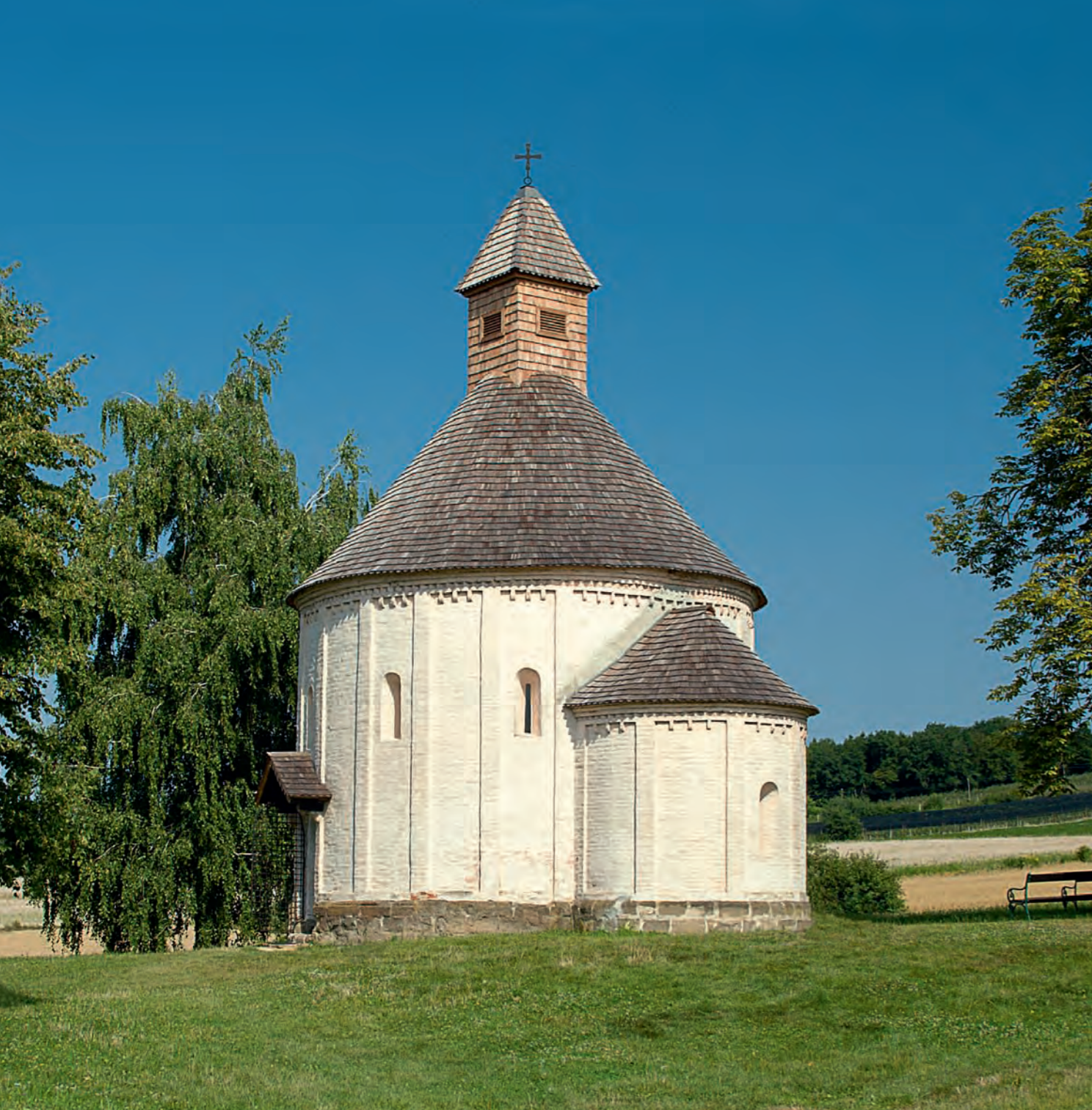
Selanska rotunda sv. Nikolaja in Device Marije